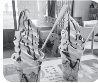
←豆乳ソフトクリーム ↓木綿豆腐